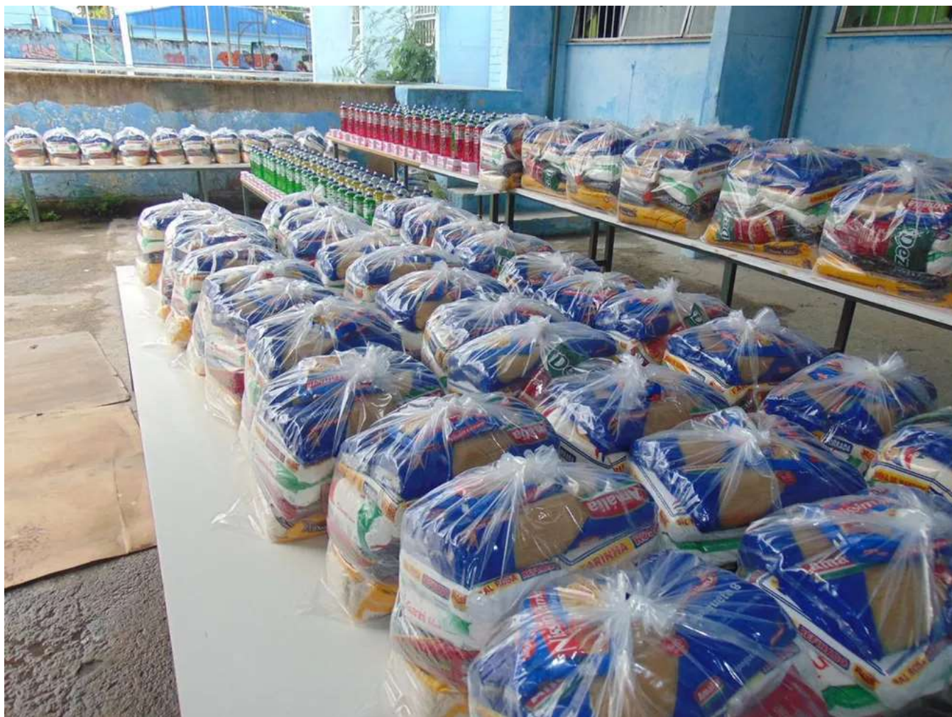
Ganso, Love, Ibson e Juliana Paes fazem doações em São Gonçalo

Os quatro são padrinhos do Projeto Educacional Socioesportivo Craque do Amanhã, que beneficia crianças e adolescentes, com idade entre 8 e 17 anos, de ambos os sexos, matriculados na rede pública de ensino, com prioridade para alunos portadores de deficiência.